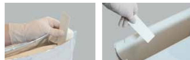
Strappare il pacco