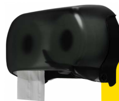
Modern Black E401102