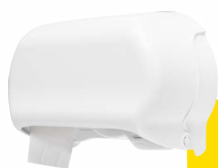
Clean White E401101